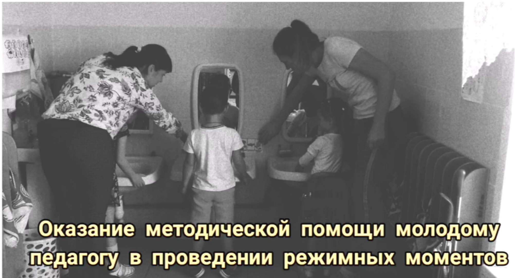
Оказание методической помощи молодому педагогу в проведении режимных моментов